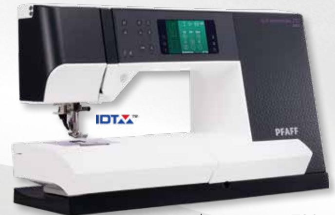
quilt expression™ 720