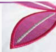
Tapering für mehr Variation beim Nähen.

Tapering – Mit allen 9-mm dekorativen Zierstichen. Nähen Sie Ihren Stich am Anfang und/oder Ende spitz zulaufend. Der Winkel der auslaufenden Stiche kann darüber hinaus noch verändert werden, für einen individuellen Look.