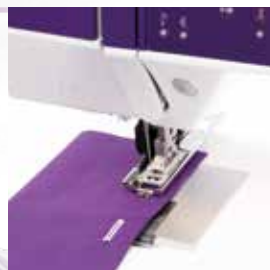
Knopflöcher schnell und präzise genäht mit der PFAFF® Knopfloch-Sensormatik.

Garantiert professionelle Knopflöcher auf jedem Stoff. Geben Sie einfach die Länge des Knopfloches ein. Die expression™ Nähmaschinen speichern diese und nähen das Knopfloch immer wieder in der gleichen Länge und Qualität.